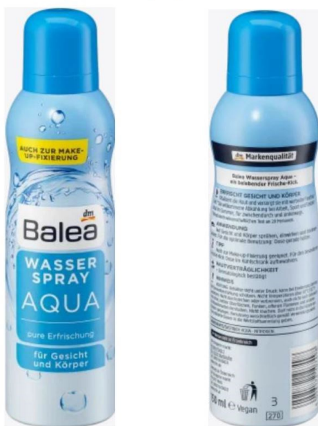
Balea Aqua Wasserspray, 150 ml